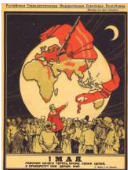
C – Cartaz comemorativo do dia do trabalhador, no contexto da guerra civil russa.