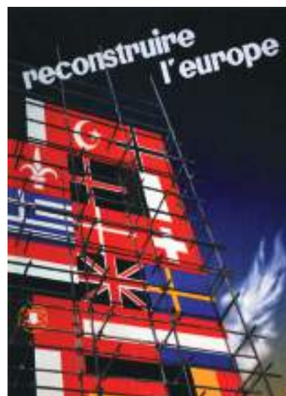
D – «Reconstruir a Europa»: cartaz de propaganda ao Plano Marshall.