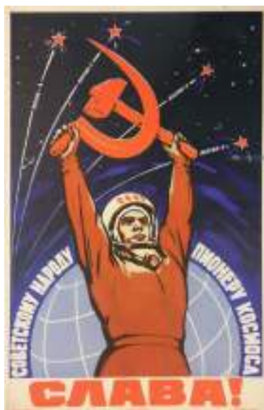
A – Cartaz do programa espacial Vostok: «Glória ao povo soviético, pioneiro do Espaço».