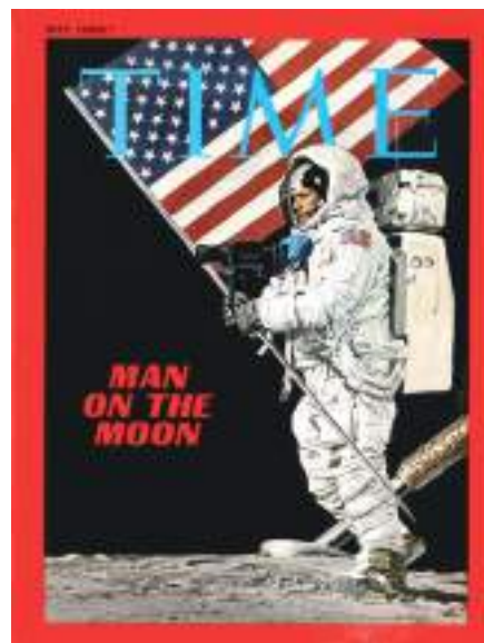
B – «Homem na Lua»: capa da revista Time .