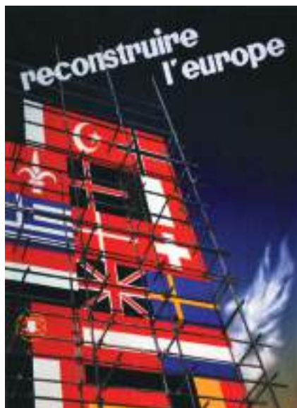
A – «Reconstruir a Europa»: cartaz de propaganda ao Plano Marshall.